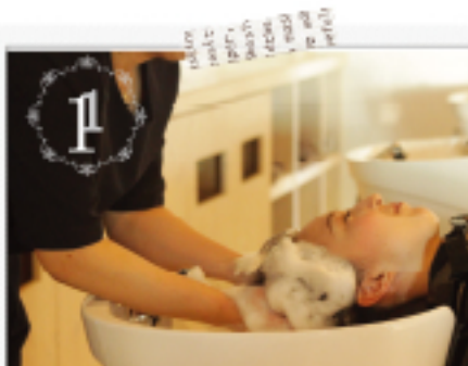
1 お一人おひとりのお悩みに適したシャンプーを使い、丁寧に洗います