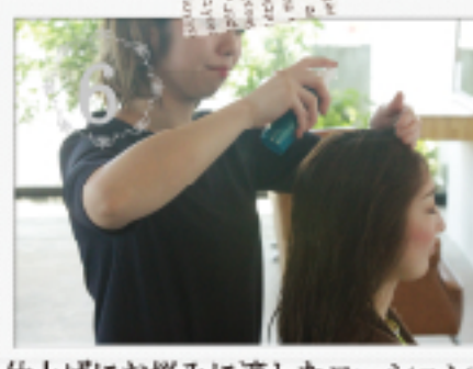
仕上げにお悩みに適したローションで潤いをしっかり閉じ込めます