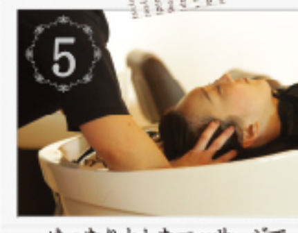
5 ゆったりとしたマッサージで血液やリンパの流れをスムーズにします