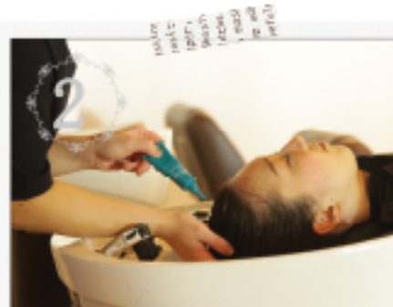
2 エッセンスをつけ頭皮に集中ケアを行い、マッサージを行う下地を作ります