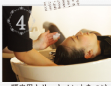
4 頭皮用トリートメントをつけ、地肌に潤いを与えます